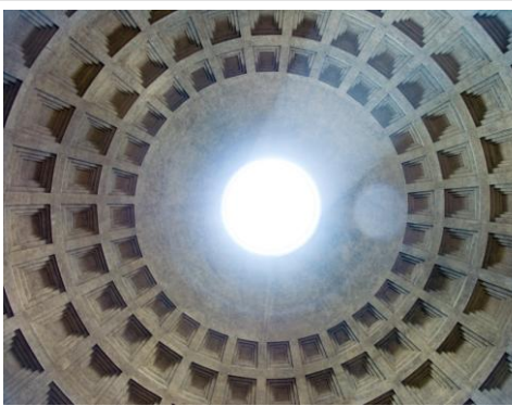
Figure 3: Panthéon, coupole

une partie antérieure, le pronaos, à colonnes et fronton. Il est en opposition formelle avec les temples de type hellénique.